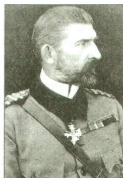
Ferdinand (Victor Adalbert Meinrad) de Hohenzollern-Sigmaringen