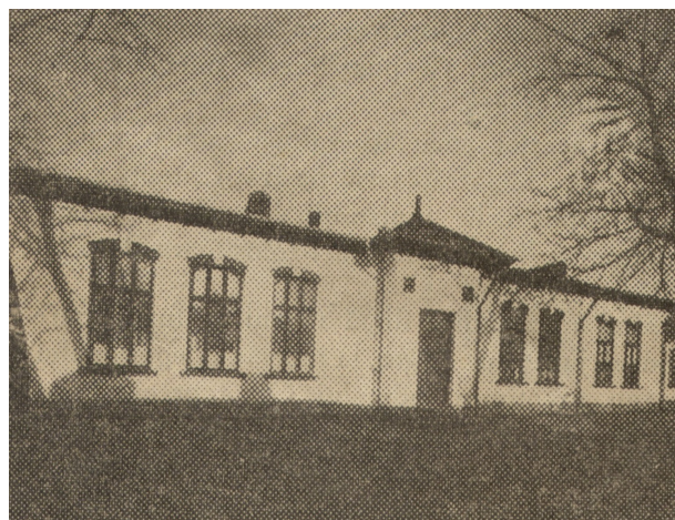
Frăția – Sediul instituției